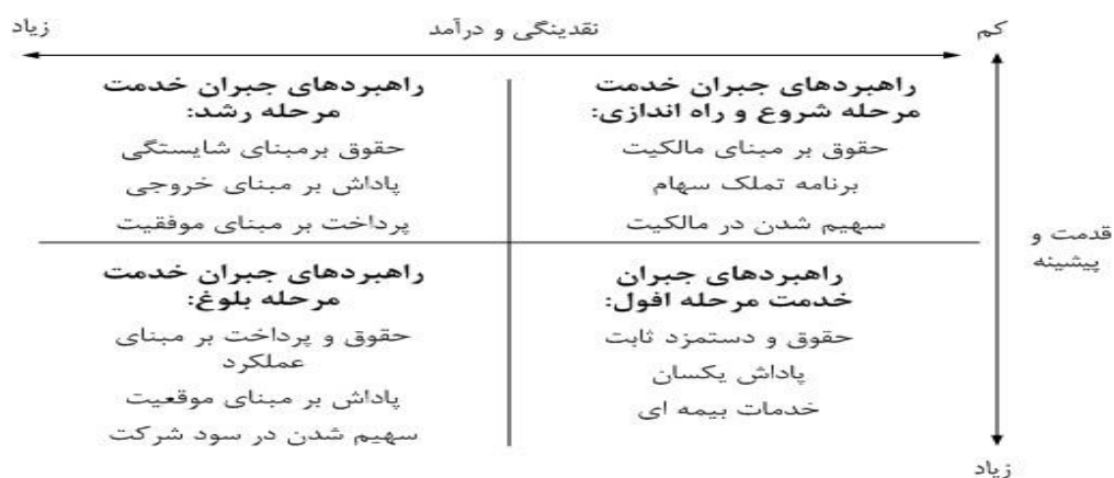
ماتریس ۱، نتیجه کلی پژوهش

با توجه به دیدگاه های ارائه شده در مرحله اول و مقایسه آن با نتایج مرحله دوم، در صورتی که اختلاف بین میانگین فازی زدایی شده در دو مرحله کمتر از (۰/۱) باشد در این صورت فرآیند نظر سنجی متوقف می شود. با توجه به اینکه اختلاف میانگین فازی زدایی شده نظر پاسخ دهندگان در دو مرحله کمتر از ۰/۱ می باشد، پاسخ دهندگان در مورد برنامه های جبران خدمت بر اساس چرخه حیات باشگاه های ورزشی به اجماع رسیدند و نظر سنجی در این مرحله متوقف می شود. این بدان معنی است که پاسخ دهندگان به برنامه های جبران خدمت بر اساس چرخه حیات باشگاه های ورزشی در پژوهش نگاه تقریباً یکسانی داشته اند. به طور کلی نتایج پژوهش را می توان در قالب ماتریس زیر نشان داد.