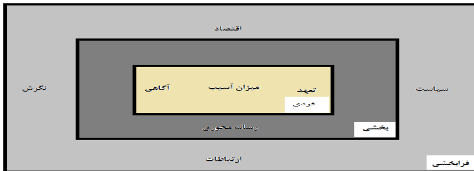
شکل ۱- بسترهای مسئولیت اجتماعی ورزشکاران

در این پژوهش در مرحله کدگذاری انتخابی به روش اشتراوس و کوربین، با توجه به نقش مفاهیم به دست آمده در تبیین فرایند طراحی الگوی مسئولیت پذیری اجتماعی ورزشکاران در قالب راهبردها، شرایط زمینه‌ای (داخلی)، شرایط مداخله گر (خارجی) و پیامدها به هم مرتبط شدند که در نمودار ۱ نشان داده شده است.