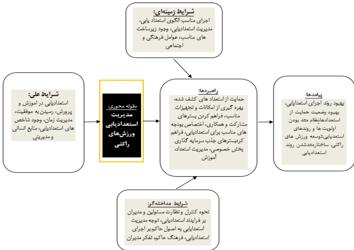
شکل ۱. مدل پارادایمی مدیریت استعدادیابی به روش استراس و کوربین در ورزش‌های راکتی

این مرحله از پژوهش کدگذاری گزینشی و مدل نهایی ارائه می‌گردد. در مرحله کدگذاری گزینشی یا انتخابی شکل‌گیری و پیوند هر دسته‌بندی با سایر گروه‌ها تشریح می‌شود. در این قسمت کدگذاری‌های محوری به صورت ترکیبی و محتوای هر یک از آنها در قالب کدهای نظری قرار داده شدند که در جدول زیر ارائه گردید: