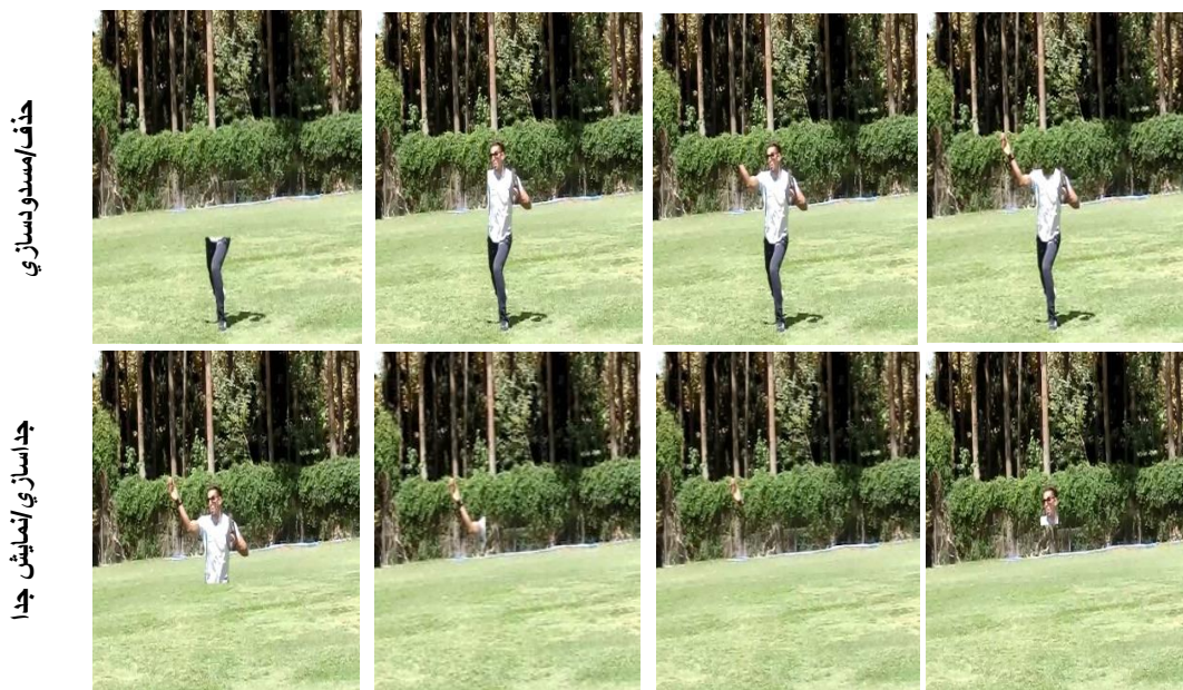
شکل ۱- انسدادهای فضایی اعمال شده. تصاویر ردیف بالا آخرین فریم‌های فیلم پیچ در شرایطی است که بخش یا بخش‌های خاصی از بدن یا توپ حذف شده است؛ در حالی که در ردیف پایینی همان بخش یا بخش‌ها جداسازی و نمایش داده شده است. تصاویر نظیر از دو ردیف بالا و پایینی مکمل همدیگرند.