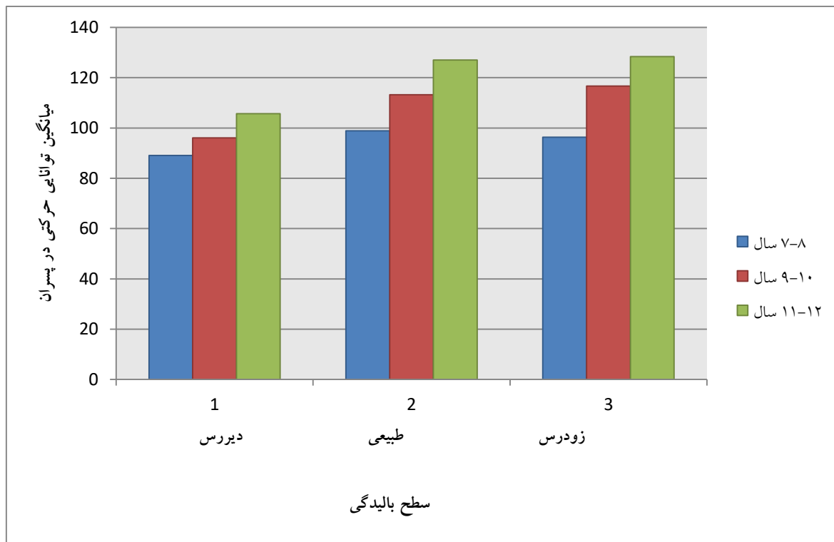
نمودار ۲. اثر تعاملی سطح بالیدگی و سن تقویمی دانش آموزان پسر

توانایی های حرکتی معنادار نیست. نمودار تعاملی ۲ نشان داد دانش آموزان پسر برای هر یک از رده های سنی ۷ تا ۸ سال، ۹ تا ۱۰ سال، ۱۱ تا ۱۲ سال در سطح بالیدگی طبیعی بالاترین نمره توانایی حرکتی و دانش آموزان پسر در رده های سنی ۷ تا ۸ سال، ۹ تا ۱۰ سال و ۱۱ تا ۱۲ سال در سطح بالیدگی دیررس دارای پایین ترین نمره توانایی حرکتی می باشند (نمودار ۲).