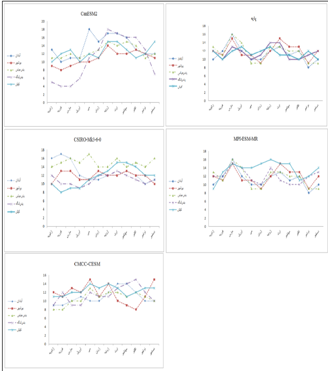
شکل ۳: امواج گرمایی استخراج شده ماهانه در داده پایه و آینده

تغییرات سالانه امواج گرمایی در دوره‌ی آینده نسبت به دوره‌ی پایه (جدول ۵) به این صورت است که فراوانی امواج گرمایی در دوره آینده برای ایستگاه‌های آبادان و بندرعباس در مدل‌های CanESM2 و CSIRO-Mk3-6-0، ایستگاه بوشهر در مدل‌های MPI-ESM-MR و CSIRO-Mk3-6-0 و ایستگاه بندرلنگه و MPI-ESM-MR نسبت به دوره پایه افزایش نشان می‌دهد اما ایستگاه کیش در تمام مدل‌های مورد بررسی با افزایش فراوانی امواج گرمایی در سال‌های آینده روبه‌رو است.