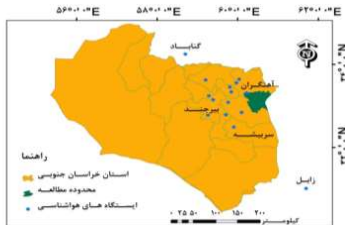
شکل ۲: موقعیت ایستگاه‌های هواشناسی محدوده مطالعه

با استفاده از داده‌های بارش روزانه ۱۵ ایستگاه هواشناسی در اطراف محدوده مطالعه (شکل ۲)، بارندگی سالانه در طول دوره سی ساله (۱۹۸۶-۲۰۱۵ میلادی) استخراج گردید سپس این داده‌ها برای محدوده مطالعه به روش IDW ۱ در نرم‌افزار ArcGIS میانمایی و با استفاده از شاخص استاندارد بارش (SPI ۲ ) سال‌های خشک، تر و نرمال مشخص شدند. برای تکمیل سال‌های فاقد داده بارندگی هریستگاه از روابط همبستگی با ایستگاه‌های مجاور و نرم‌افزار SPSS استفاده شد.