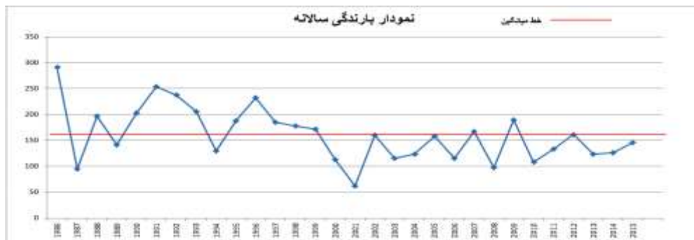
شکل ۴: تفکیک دو دوره مرطوب و خشک در بررسی سی ساله

شکل ۵، طبقات بارش سالانه در سری زمانی سی ساله محدوده مطالعه را بر اساس شاخص استاندارد بارش (SPI) نشان می‌دهد. ترسالی و خشکسالی با شدت‌های مختلف همچنین تغییرات بارندگی سالانه در سال‌های نرمال رخدادهایی هستند که در این نمودار ارائه گردیده‌اند.