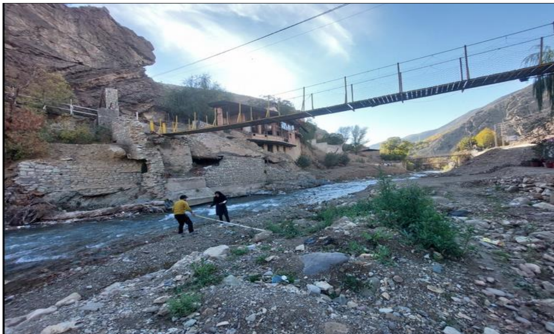
شکل ۶. تصویری از بازه فرسایش پذیری در کناره چپ و رسوبگذار در کناره راست رودخانه جاجرود از رودک تا کلیگون (بازه ۳)