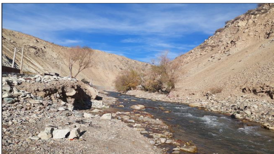
شکل ۵. تصویری از بازه فرسایش پذیر رودخانه جاجرود، از امین آباد تا رودک (بازه ۲)