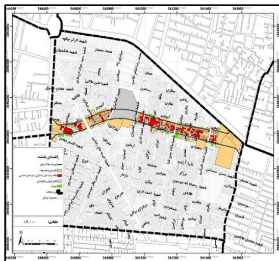
شکل ۴. نقشه وضعیت کیفیت قطعات در محور احداثی