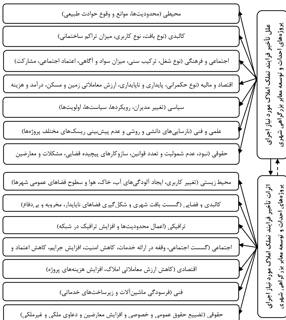
شکل ۱. مدل مفهومی (علل و تأثیر تأخیر فرایند تملک املاک و اجرای پروژه‌های احداث و توسعه بزرگراه‌های شهری)

۳. اثرات ترافیکی و حمل‌ونقلی: تأخیر مستمر و زیاد در فرایند تملک املاک مورد نیاز پروژه‌های احداث و توسعه بزرگراه‌ها و سایر جاده‌های شهری، اعمال محدودیت‌های مدیریتی و فیزیکی (بسته شدن و ایجاد مسیرهای انحرافی) و افزایش ترافیک سواره در معابر پیرامون آن پروژه‌ها را موجب می‌شود.