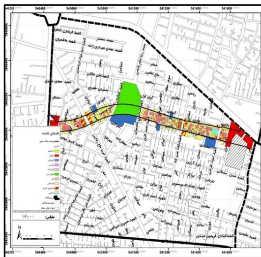
شکل ۵. کاربری‌های محدوده پوسه ۴۵ متری بزرگراه پیشنهادی