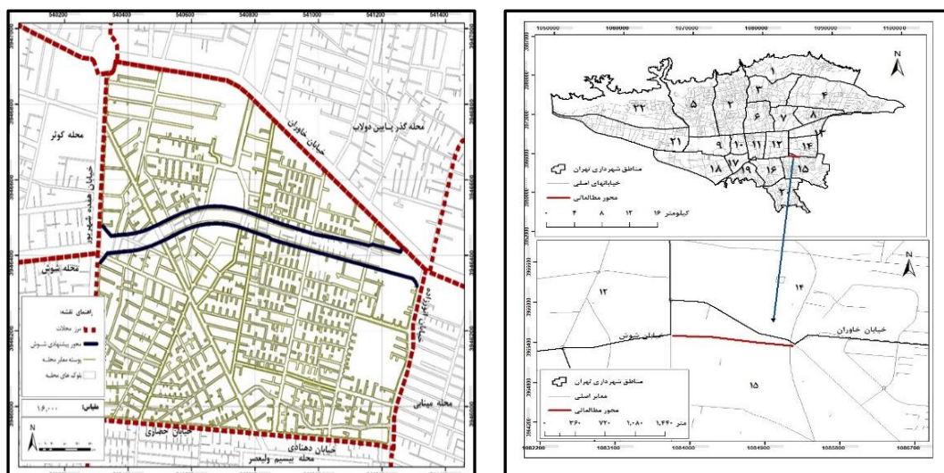
شکل ۲. نقشه موقعیت پروژه احداث بزرگراه شوش در محله طیب در منطقه ۱۵ شهرداری تهران