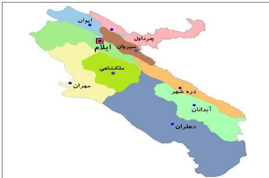
شکل ۲: موقعیت جغرافیای شهرستان دهلران در استان ایلام

شهرستان دهلران در جنوب ایلام و در فاصله ۹۱۰ کیلومتری تهران واقع شده است. دهلران آب و هوای بیابانی و نیمه بیابانی «گرم و خشک» دارد. این شهرستان در جنوب شرقی استان ایلام و جنوب غربی دینار کوه و در فاصله ۲۲۸ کیلومتری ایلام و ۱۰۰ کیلومتری شهرستان اندیمشک واقع شده است. این شهر که در دامنه جنوب و جنوب غربی دینار کوه قرار دارد. شکل ۲ موقعیت جغرافیای شهرستان دهلران در استان ایلام را نشان می دهد.