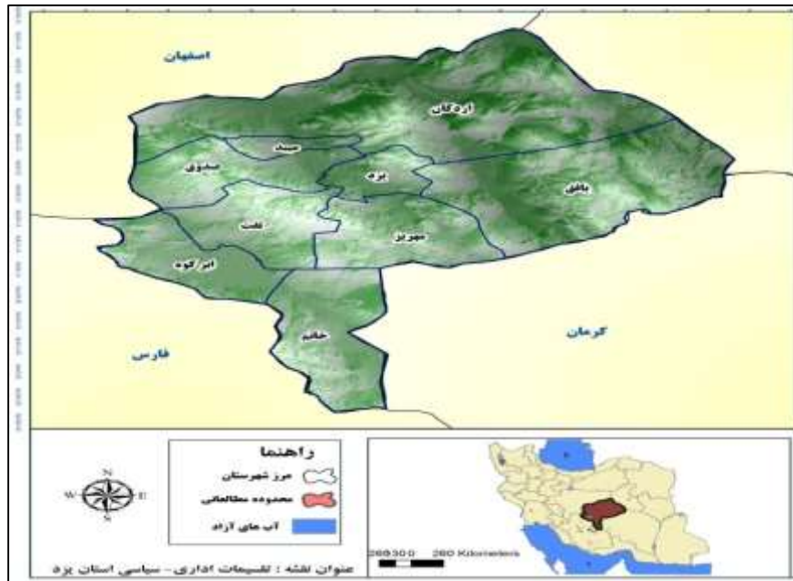
شکل ۱: محدوده مطالعه، استان یزد.