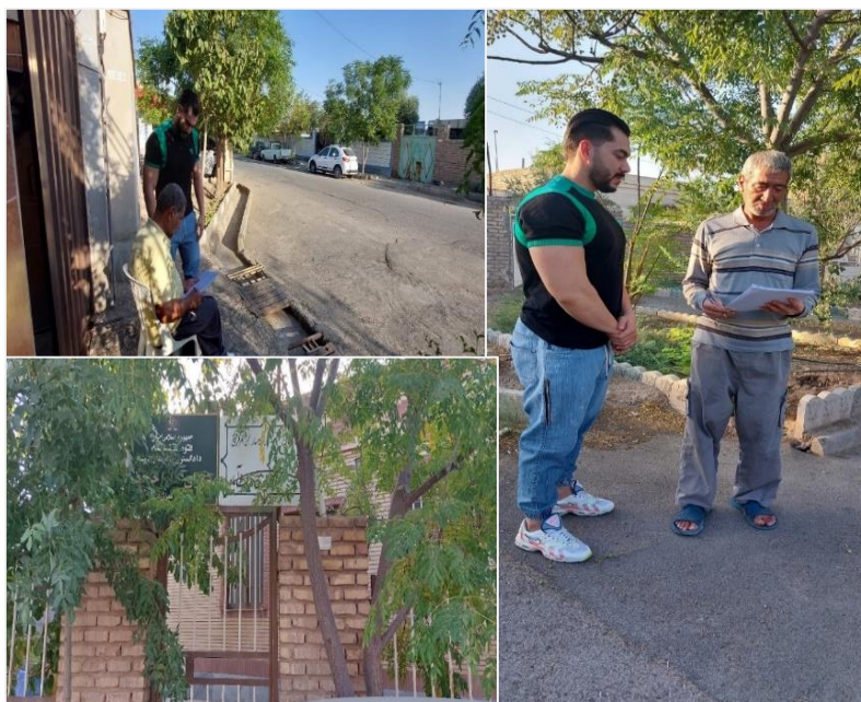
شکل ۲. نقشه منطقه مورد مطالعه

در شهرستان گرمسار روستاهای متعددی از جمله غیث آباد، شورقازی، محسن آباد، نورالدین، ریکان، قاتول، کردوان و غیره وجود دارد که در این پژوهش، تمرکز بر روستاهای غیث آباد، شورقازی و محسن آباد می‌باشد (شکل ۲)، که طرح بیابان‌زدایی دارند. این روستاها در جنوب شهر گرمسار واقع شده‌اند، طبق آخرین سرشماری، تعداد خانوار ساکن در روستای غیث آباد ۲۸۰، تعداد خانوار ساکن در روستای شور قاضی ۵۰ و تعداد خانوار ساکن در روستای محسن آباد ۱۵۰ خانواده می‌باشد. در سه روستای مذکور، عمده فعالیت افراد، پرورش گوساله و دام‌پروری، کشاورزی و سبزی‌کاری می‌باشد.