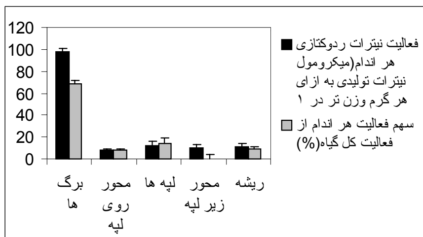
شکل ۳- فعالیت نیترات ردوکتازی اندام‌های گوناگون نمونه‌های شاهد، دانه‌ست‌های سویا رقم پرشینگ، و سهم فعالیت هر اندام از فعالیت کل گیاه بر حسب درصد. ستون‌ها و شاخص‌ها نشان‌گر میانگین و محدوده‌های خطای معیار هستند

جدول ۲- تغییرات فعالیت نیترات ردوکتازی اندام‌های گوناگون دانه‌ست‌های ۱۵ روزه سویا، رقم پرشینگ و تأثیرات شوری بر آن. آماده‌سازی نمونه‌ها، مانند شرح شکل ۲ صورت گرفته است. اعداد بر حسب میکرومول نیترات احیا شده به ازای هر گرم وزن تر اندام در یک ساعت ارائه شده‌اند و نشان‌گر میانگین و محدوده‌های خطای معیار هستند