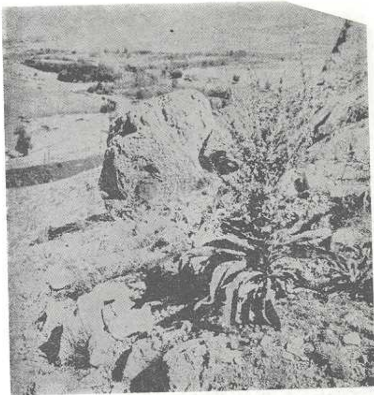
يك نمونه از گیاه Verbascum از محل مربوط به تصویر شماره ۴