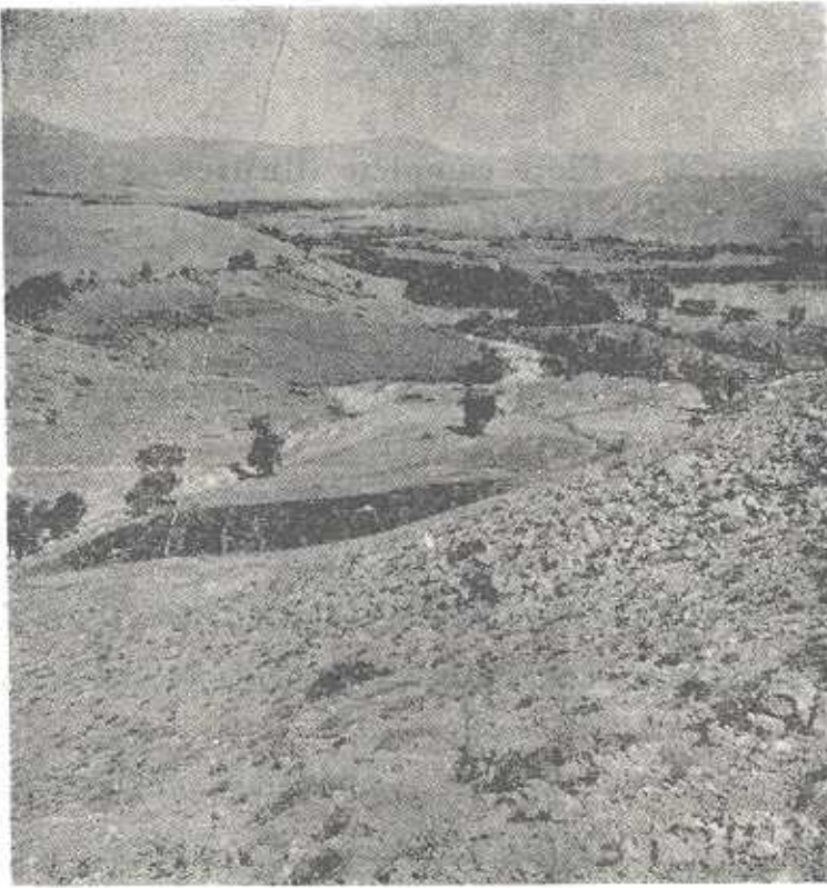
تصویر شماره ۳- دامنه شمالی کوه ازنو متشکل از خاک و واریزه آهکی ودشت و باغات شمالی تر آن که از جنس خاکهای مخلوط آهکی و آتشفشانی است .