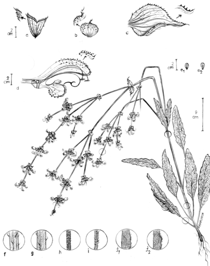
شکل ۳. شکل رویشی سالویا آتروپاتانا (۹۱): (a) کاسه گل، (b) براکته، (c) برگ گل آذینی، (d) جام گل، (e1-e2) فندقه، (f) قاعده ساقه، (g) بخش فوقانی ساقه، (h) محور گل آذین، (i) دم‌برگ، (j1) سطح فوقانی برگ، (j2) سطح تحتانی برگ. (مؤلف مقاله)

اجزاء گل: سطح کاسه‌گل دارای کرک‌های تیز زبر و خمیده و تراکم کرک متوسط تا تنک و رنگ کاسه گل سبز- بنفش است. طول سوزن لوب بالایی کاسه گل ۸/۰ - ۵/۰ میلی‌متر است. طول جام گل ۲۶-۲۵/۵ میلی‌متر، طول لوله جام گل ۵ میلی‌متر و در سطح گلبرگ کرک‌های تیز و زبر و خمیده مشاهده می‌شود. طول خامه ۴۴/۵ میلی‌متر است.