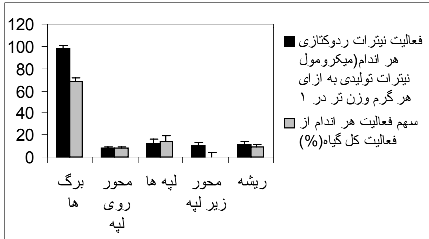
شکل ۳- فعالیت نیترات ردوکتازی اندام‌های گوناگون نمونه‌های شاهد، دانه‌ست‌های سویا رقم پرشینگ، و سهم فعالیت هر اندام از فعالیت کل گیاه بر حسب درصد. ستون‌ها و شاخص‌ها نشان‌گر میانگین و محدوده‌های خطای معیار هستند

جدول ۲- تغییرات فعالیت نیترات ردوکتازی اندام‌های گوناگون دانه‌ست‌های ۱۵ روزه سویا، رقم پرشینگ و تأثیرات شوری بر آن. آماده‌سازی نمونه‌ها، مانند شرح شکل ۲ صورت گرفته است. اعداد بر حسب میکرومول نیترات احیا شده به ازای هر گرم وزن تر اندام در یک ساعت ارائه شده‌اند و نشان‌گر میانگین و محدوده‌های خطای معیار هستند