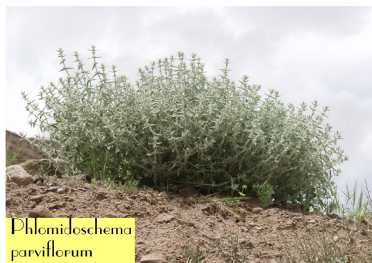
شکل ۳. تصویری از گونه Phlomidioschema parviflorum .