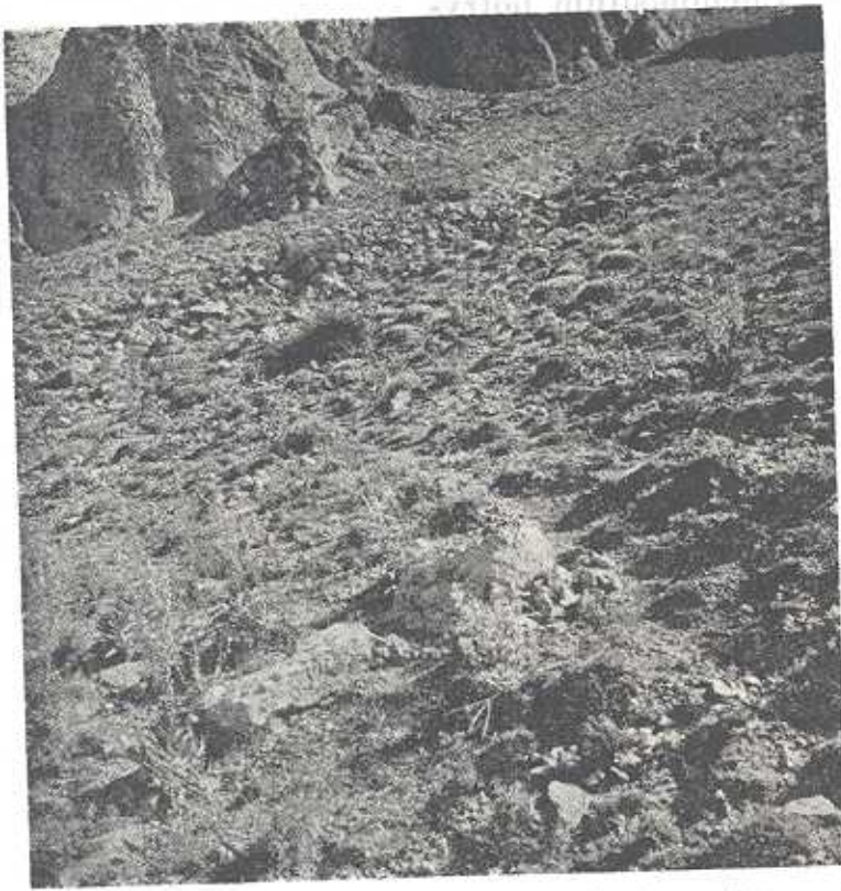
تصویر شماره ۱- اجتماع Acantholimon دامنه‌ارتفاعات آهکی از نو (در ارتفاع ۱۷۰۰ متر) متشکل از واریزه آهکی و خاک که در آن اجتماع آکاتولیمون همراه با گیاهان دیگری مانند Astragalus و Verbascum