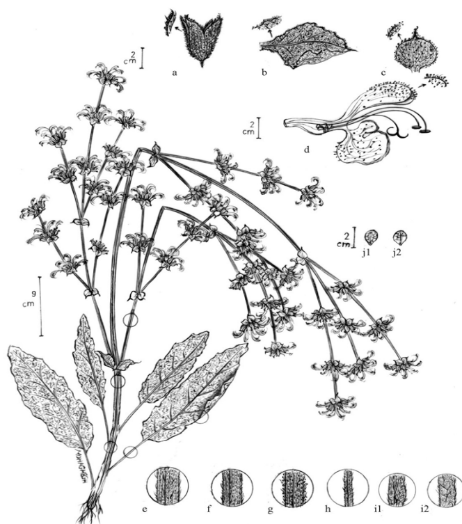
شکل ۱. شکل رویشی سالویا آتروپاتانا (۸۴): (a) کاسه‌گل، (b) برگ گل آذینی، (c) براکته، (d) جام گل، (e) قاعده ساقه، (f) بخش فوقانی ساقه، (g) محور گل آذین، (h) دم‌برگ، (i1) سطح فوقانی برگ، (i2) سطح تحتانی برگ، (j1، j2) فندقه (مؤلف مقاله)

تعداد گل در هر چرخه از محور گل آذین ۶-۷ گل، دم‌گل ۲ تا ۳/۵ میلی‌متر و تنها شامل پوشش مودار و کم و بیش زیر است.