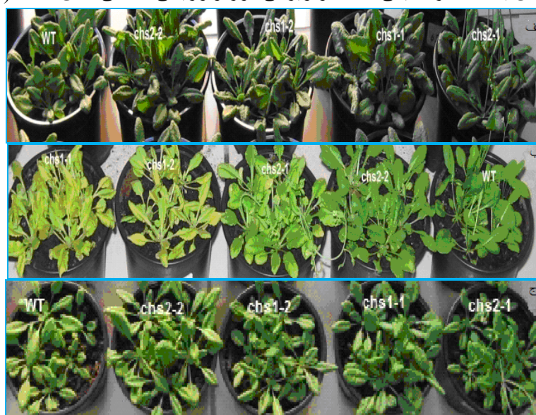
شکل ۱. گیاهان تحت تیمارهای دمایی متفاوت. الف) گیاهان شاهد، ب) گیاهان تحت تیمار سرما، ج) گیاهان تحت تنش سرما

ویژگی‌های مورفولوژیکی ناشی از دمای پایین در گیاهان جهش یافته آرابیدوپسیس تحت تیمار سرما مشاهده شد. تحت این تیمار دمایی برگ گیاهان جهش یافته زرد شد و پس از یک هفته قرارگیری در معرض تیمار سرما همه این گیاهان از بین رفتند و با بازگشت به دمای رشد نرمال زنده نماندند (شکل ۱ ب). تحت تنش سرما و شاهد گیاهان وحشی و جهش یافته ظاهر طبیعی داشتند و ویژگی مورفولوژیکی خاصی نشان ندادند (شکل ۱ الف ج).