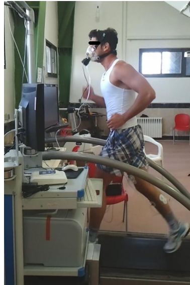
شکل ۱. پروتکل دویدن با استفاده از نوارگردان و دستگاه گاز آنالایزر متامکس در آزمایشگاه شبیه‌سازی شده به دویدن در یک مسابقه دو ۵۰۰۰ متر استقامت

هنگام اجرای آزمون، همچنان‌که سرعت دویدن افزایش می‌یافت، اکسیژن مصرفی نیز قبل از رسیدن به حالت پایدار افزایش پیدا کرد. برای بررسی تغییرات اکسیژن مصرفی در مجموع پروتکل به این صورت عمل شد که اکسیژن مصرفی دو دقیقه انتهایی تمام آزمودنی‌ها برای هر سه سرعت ۴، ۶ و ۸ کیلومتر بر ساعت انتخاب شد. در نتیجه برای هر وزن یک ستون از داده‌های اکسیژن مصرفی به دست آمد. با مقایسه اکسیژن مصرفی کل دوره آزمون در هر وزن، به مشاهده اثر تغییرات وزن کفش بر میزان تغییرات اکسیژن مصرفی و در نتیجه اقتصاد دویدن پرداخته شد. اقتصاد دویدن از طریق محاسبه میانگین اکسیژن مصرفی دو دقیقه انتهایی هر مرحله، در صورتی‌که به حالت پایدار می‌رسید، تخمین زده شد. میانگین اکسیژن مصرفی به دست آمده، هزینه اکسیژن را که برای رسیدن به آن سرعت نیاز است نشان می‌دهد که می‌تواند بین دوندها مقایسه شود. مصرف اکسیژن کمتر برای رسیدن به یک سرعت مشخص نشان‌دهنده دویدن اقتصادی‌تر است. برای محاسبه OUES از روش بابا و همکاران (۱۹۹۶) استفاده شد (۱۶) که در آن اکسیژن مصرفی (میلی لیتر بر دقیقه) روی محور عمودی و تهویه کل (میلی لیتر بر دقیقه بر کیلوگرم) در تابع لگاریتم روی محور افقی قرار می‌گیرد. شیب خط معادله یک مجهولی ارتباط دو محور افقی و عمودی به عنوان OUES در نظر گرفته می‌شود (معادله ۱) (۱۴، ۱۵).