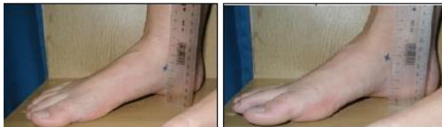
وضعیت بدون تحمل وزن

در ادامه مطالعه منصرف شدند. تمام فعالیت‌های تمرینی بازیکنان از ابتدا تا انتهای فصل در فرم ویژه به صورت روزانه به دست مربی تیم ثبت می‌شد. از کادر پزشکی تیم‌های مشارکت‌کننده درخواست شد آسیب‌های بازیکنان را در فرم ویژه ثبت کنند. این فرم‌ها به صورت هفتگی جمع‌آوری می‌شد. در این مطالعه، آسیبی ثبت می‌شد که در تمرین یا مسابقه رخ داده باشد و بازیکن آسیب‌دیده قادر نباشد در جلسه تمرینی یا مسابقه روز بعد تیم (حداقل ۴۸ ساعت) مشارکت جوید (تعریف آسیب بر مبنای غیبت از تمرین یا مسابقه) (۲،۶). در ابتدای این مطالعه، فرم رضایت‌نامه اخلاقی به دست بازیکنان امضا شد و سپس، در ابتدای فصل، افت ناوی پای چپ و راست، زاویه Q چپ و راست، زانوی پرائتزی، زانوی ضربدری و زاویه هایپیر اکستنشن مفصل زانوی بازیکنان اندازه‌گیری شد. برای اندازه‌گیری افت ناوی از آزمون برودی استفاده شد. برای این کار، ابتدا از آزمودنی درخواست می‌شد روی صندلی بنشیند، درحالی‌که ران و زانوی او در وضعیت فلکشن ۹۰ درجه، کف پاهای او روی زمین و مفصل ساب تالار او در وضعیت خنثی و در وضعیت بدون تحمل وزن قرار داشت. آزمونگر برجستگی استخوان ناوی آزمودنی را لمس و مشخص می‌کرد و فاصله آن را تا زمین با خطکش اندازه‌گیری می‌کرد. سپس، از آزمودنی خواسته شد در وضعیت ایستاده قرار گیرد و پاها را به اندازه عرض شانه باز کند و وزن بدن را به طور مساوی روی دو پا در وضعیت تحمل وزن قرار دهد. فاصله استخوان ناوی تا زمین دوباره اندازه‌گیری خواهد شد. اختلاف بین این دو وضعیت به میلی‌متر به منزله مقدار افت ناوی ثبت می‌شد (شکل ۱) (۲۳).