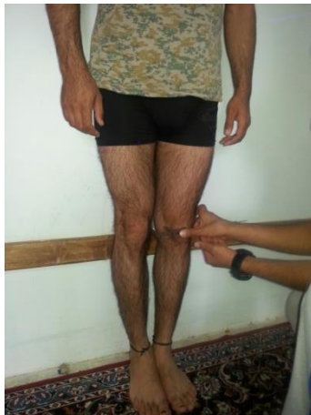
شکل ۳. نحوه اندازه‌گیری زانوی پراتنزی

جهت ارزیابی میزان ناهنجاری‌های زانوی پراتنزی و ضربدري، از یک کولیس با دقت ۱ میلی‌متر استفاده شد. برای اندازه‌گیری زانوی پراتنزی، آزمودنی درحالت ایستاده و راحت، درحالی‌که قوزک‌های داخلی را به هم چسبانده و کاملاً نزدیک کرده است و هیچ‌گونه فشار و انقباض غیرطبیعی را تحمل نمی‌کند قرار دارد. در این وضعیت فاصلهٔ میان دو اپی‌کندیل داخلی استخوان ران از نمای مقابل اندازه‌گیری و به میلی‌متر ثبت می‌شد (شکل ۳) (۲۶، ۲۵).