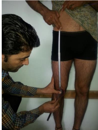
شکل ۲. نحوه اندازه‌گیری زاویه Q

جهت ارزیابی میزان ناهنجاری‌های زانوی پراتنزی و ضربدري، از یک کولیس با دقت ۱ میلی‌متر استفاده شد. برای اندازه‌گیری زانوی پراتنزی، آزمودنی درحالت ایستاده و راحت، درحالی‌که قوزک‌های داخلی را به هم چسبانده و کاملاً نزدیک کرده است و هیچ‌گونه فشار و انقباض غیرطبیعی را تحمل نمی‌کند قرار دارد. در این وضعیت فاصلهٔ میان دو اپی‌کندیل داخلی استخوان ران از نمای مقابل اندازه‌گیری و به میلی‌متر ثبت می‌شد (شکل ۳) (۲۶، ۲۵).