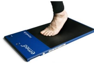
تصویر ۱. نحوه قرارگیری پا در وسط پلت فرم و نمایش فشار کف پا از طریق نرم افزار