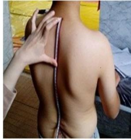
شکل ۲. نحوه اندازه‌گیری و محاسبه زاویه قوس پشتی بوسیله خط کش منعطف

برای اندازه‌گیری زاویه کرانیوورترال (CV) از گونیامتر مخصوص HPSCL ساخت ایران استفاده شد. جهت ارزیابی، زائده خاری CV تعیین و علامت‌گذاری شد. سپس در حالی که کودک در یک وضعیت طبیعی روبه رو را نگاه می‌کرد، در نمای جانبی، محقق، محور گونیامتر را موازی با زائده خاری مهره CV و بازوی متحرک آن را روی تراگوس گوش (غضروف بخش قدامی) تنظیم کرد. زاویه میان بازوی متحرک و خط افقی که از مهره CV عبور می‌کند، زاویه کرانیوورترال است (۲۱). میانگین سه مرتبه اندازه‌گیری، برای تحلیل نهایی به کار رفت. دامنه حرکتی اکستنشن و فلکشن زانو و ران و ابداکشن ران با گونیامتر یونیورسال ۳۶۰ درجه اندازه‌گیری شد که در تحقیقات گذشته رویایی بالا و پایایی خوب تا عالی برای آن گزارش کردند (۲۴، ۲۵) و با استناد به توصیه‌های آکادمی جراحان ارتوپدی آمریکا (۱۱)، در هریک از شرکت‌کنندگان در سه آزمایش، اندازه‌گیری شد و میانگین آنها برای تحلیل نهایی به کار رفت. لازم به ذکر است با قرار دادن دست روی ران و لگن طرف مقابل مانع از هرگونه حرکت جبرانی و ایجاد خطا در اندازه‌گیری گشت.