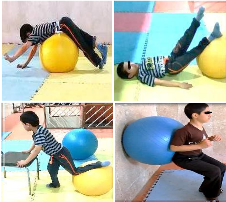
شکل ۳. نمونه‌هایی از تمرینات انجام شده

در تحقیق حاضر برای طبقه‌بندی و خلاصه‌سازی اطلاعات از آمار توصیفی، میانگین و انحراف معیار و برای تحلیل داده‌ها از آزمون t وابسته در سطح معناداری ( P \leq 0/05 ) در نرم افزار آماری SPSS نسخه ۲۲ استفاده شد.