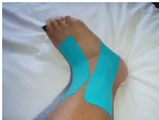
شکل ۱. تیپ کینزیو در مچ پا