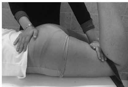
شکل ۱. نحوه اندازه‌گیری بیشینه قدرت ایزومتریک عضله سرینی بزرگ

انجام آزمون از بندهای محکم غیرقابل ارتجاع که از یک سمت به انتهای اندام موردنظر و از طرف دیگر به پایه تخت بسته می‌شد استفاده شد. این امر باعث اعتباربخشی بیشتر به آزمون‌های سنجش قدرت ایزومتریک با دینامومتر دستی می‌گردد (۲۶). از آزمودنی خواسته می‌شد که ۵ شماره با نهایت قدرت به دینامومتر دستی دیجیتال مدل JTECH Medical MN084_A Commander که در انتهای اندام و زیر بند ثابت‌کننده قرار داشت فشار وارد کند. مجموعاً سه بار اندازه‌گیری قدرت با انجام باز کردن بیش از حد ران به مقدار ۲۰ درجه، انقباضات ۵ ثانیه‌ای و استراحت ۳۰ ثانیه‌ای بین تکرارها انجام شد. میانگین سه عدد به دست آمده به عنوان ماکزیمم قدرت ایزومتریک عضله برحسب نیوتن ثبت گردید (۲۷). عدد به دست آمده بر وزن فرد برحسب نیوتن تقسیم شده و ضربدر عدد ۱۰۰ شد و ماکزیمم قدرت عضله برحسب درصد وزن بدن گزارش گردید.