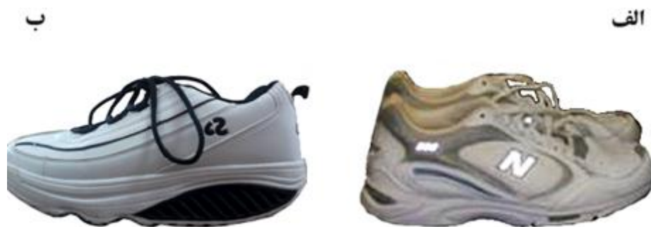
شکل ۱- الف: کفش کنترل؛ ب: کفش ناپایدار

کفش‌های تحت بررسی در این پژوهش در اندازه‌های ۴۲ تا ۴۴ برحسب اندازه پای آزمودنی‌ها تهیه شدند که شامل کفش کنترل (New Balance) و کفش ناپایدار (Perfect Steps- TM-030709 VP) بود (شکل ۱). این کفش‌ها به منظور مقایسه تأثیر شکل هندسه زیره کفش بر متغیرهای مرتبط با نیروی عکس‌العمل زمین انتخاب شدند. کفش ناپایدار انحنایی در راستای قدامی - خلفی دارد؛ درحالی که کفش کنترل دارای زیره معمولی بود.