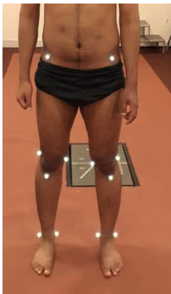
شکل ۲. لندمارک‌های آناتومیکی

BLA متعلق به شرکت پویان آزما (شکل ۳). برای هر آزمودنی، سه اندازه‌گیری توسط تکنسین‌های با تجربه انجام شد و میانگین این سه آزمون برای تجزیه و تحلیل مورد استفاده قرار گرفت.