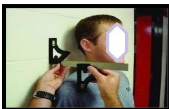
شکل ۷. اندازه‌گیری شانه روبه‌جلو (برگرفته از کار پژوهشی معصومی و همکاران ۲۰۱۱)

اندازه‌گیری شانه به جلو: برای تعیین کمیت وضعیت شانه به جلو (شانه گرد) از دستگاه چهارگوش دوگانه (طبق مدل 420 EM) استفاده شد. روایی و اعتبار چهار گوش ارزیابی شانه به جلو به صورت تخمین، بیان شده و محققین گزارش کردند که روش استفاده از چارگوش دوگانه همبستگی متوسطی با اندازه‌گیری رادیوگرافی داشته و از اعتبار بالایی ( ICC=0/89 ) برخوردار است (۱۱). در این روش از آزمودنی خواسته شد پوشش بالاتنه خود را درآورده و روبروی آزمونگر بایستد. بعدازآن زائده آخرومی سمت چپ و راست به عنوان نقطه‌ی مرجع علامت‌گذاری شد. سپس آزمودنی در جلوی دیوار ایستاده و ده بار درجای نظامی انجام داده، شانه‌هایش را سه بار به طرف جلو و عقب گرد کرده و سپس پنج بار سرش را جلو و عقب می‌برد. این توالی حرکت برای ایجاد یک وضعیت ایستادن نرمال انجام شد. آزمودنی بعدازآن به طرف عقب به سمت دیوار حرکت کرد تا وقتی که باسنش دیوار را لمس کند در این وضعیت باقی می‌ماند تا اندازه‌گیری کامل شود. بعدازآن فاصله بین دیوار و سر قدامی زائده آخرومی با استفاده از چهارگوش دوگانه به سانتی‌متر ثبت می‌شد، در ضمن اندازه‌گیری در هر شانه سه بار تکرار شده و میانگین آن‌ها در دست برتر (دست برتر آزمودنی‌ها قبل از آزمون با پرتاب توپ معلوم شده بود) استفاده می‌شد (۱۱، ۱۶).