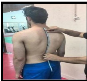
شکل ۸. اندازه‌گیری زاویه کایفوز با خط کش منعطف (برگرفته از کار پژوهشی رجبی و همکاران ۱۳۹۴)

است و مهره پایینی آن مهره اول پشتی است. سپس با استفاده از شمارش مهره چهارم سینه‌ای مشخص می‌شود. برای یافتن زائده خاری مهره دوازدهم سینه‌ای از روش یوداس استفاده شد. به‌گونه‌ای که آزمونگر در پشت آزمودنی قرار می‌گرفت و لبه تحتانی دنده‌های دوازدهم در دو طرف بدن به صورت هم‌زمان با استفاده از انگشتان شست لمس و مسیر آن‌ها به سمت بالا و داخل ادامه داده شد تا جایی که آن‌ها در زیر بافت نرم ناپدید شوند، در این لحظه مسیر دو انگشت به صورت افقی به یکدیگر متصل شد تا به زوائد خاری مهره‌ها برسد. این محل زائده خاری مهره دوازدهم سینه‌ای است. سپس این دو نقطه با استفاده از رنگ تیره نشانه‌گذاری شد که به‌سادگی از روی پوست قابل پاک شدن بود (به منظور اطمینان یک‌بار دیگر از زائده خاری مهره هفتم گردن تا مهره دوازدهم پشتی شمارش شد). سپس فرد در محلی که برای او مشخص شده بود در شرایطی که پاها به‌اندازه عرض شانه از یکدیگر فاصله داشت در حالت طبیعی ایستاده و روبه‌جلو و بدون حرکت قرار گرفت و خط کش منعطف بر روی ستون فقرات در حد فاصل مشخص شده قرار گرفت و پس از شکل‌پذیری به‌آرامی و بدون ایجاد تغییر روی کاغذ منتقل شد و با مداد شکل قوس از روی لبه‌ای از خط کش که با پوست در تماس بود بروی کاغذ انتقال داده شد و هر اندازه‌گیری سه مرتبه تکرار شد. نقطه مبدأ قوس رسم شده با خط مستقیم به نقطه انتهایی آن متصل شد و به عنوان (ال) و از عمیق‌ترین نقطه در حد فاصل نقطه مبدأ به نقطه انتهایی به صورت عرض از شکل قوس به خط طولی متصل شد و به عنوان (اچ) در نظر گرفته شد. سپس با استفاده از فرمول مثلثاتی ( ICC = 0.95 ) میزان زاویه کایفوز تعیین شد (۱۷). میانگین هر سه اندازه‌گیری مربوط به هر یک از نمونه‌ها به عنوان زاویه کایفوز ثبت شد (۱۷).