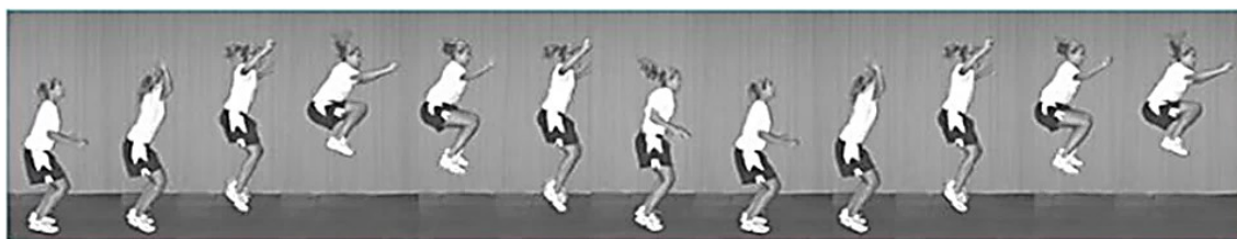
شکل ۱. تست پرش تاک (۳۳)

در این پژوهش قد آزمودنی‌ها با قدسنج و وزن آن‌ها از ترازوی دیجیتال استفاده شد. جهت ارزیابی نقص تنه از تست پرش تاک با پایایی بین آزمونگر (۹۳/۱) و پایایی درون آزمونگر (۸۷/۱) استفاده شد. در این آزمون فرد با پاهای باز به اندازه عرض شانه می‌ایستد و به صورت عمودی شروع به پرش می‌کند و زانوهای خود را تا حد امکان بالا می‌آورد. در بالاترین نقطه پرش، ران‌ها موازی با زمین قرار می‌گیرند. بلافاصله بعد از فرود، فرد باید پرش تاک بعدی را شروع کند. آزمودنی پرش تاک را به مدت ۱۰ ثانیه به صورت متوالی تکرار می‌کند. برای بهبود دقت ارزیابی از دو دوربین فیلمبرداری در دو نمای قدامی و جانبی استفاده شد، دوربین‌ها با فاصله سه متری از آزمودنی‌ها تنظیم شدند تا تصویر به صورت درشت‌نمایی شده برای بررسی در اختیار پژوهشگر قرار بگیرد، پس از انجام آزمون، برای بررسی سکانس‌های پرش، از نرم‌افزار کینوا استفاده شد فردی که قادر نباشد در محل شروع پرش خود فرود بیاید، در نقطه اوج پرش ران‌های موازی با زمین قرار نگیرد و پرش هایش در طول ۱۰ ثانیه با وقفه انجام گیرد، به عنوان فرد دارای نقص تنه در نظر گرفته شد (۱۸). هر آزمودنی سه بار با آزمون پرش ارزیابی شد و میانگین امتیازات ورزشکاران ثبت شد تا افراد مبتلا به نقص عصبی - عضلانی و به خصوص نقص تنه شناسایی شوند (شکل ۱) (۱۸).