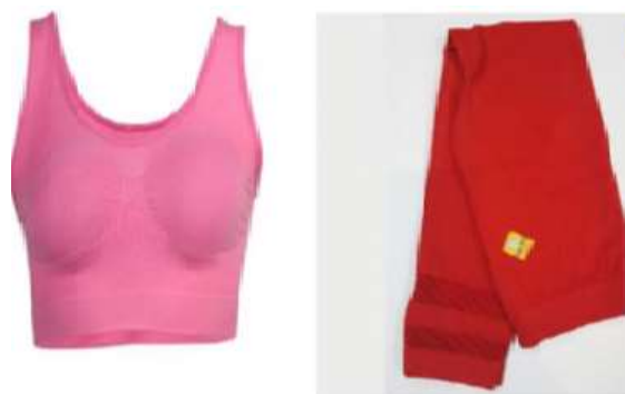
شکل ۱- نمونه‌ای از لباس‌های مورد استفاده در تحقیق

لباس‌های مذکور دارای ترکیبی شامل ۵۲ درصد نخ خنک‌کننده CoolMax پلی‌استر و ۴۸ درصد نخ ضدباکتری Nano silver و ZnO است.