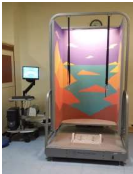
شکل ۱. دستگاه پاسچروگرافی پویای کامپیوتری.

برای اجرای آزمون SOT با انتخاب نوع آزمون تعبیه شده در دستگاه، شرکت‌کننده با پاهای برهنه بر روی سکوى نیروی دستگاه پاسچروگرافی می‌ایستاد به گونه‌ای که فاصله پاها به اندازه عرض لگن معادل ۵۰ درصد فاصله هیپ تا هیپ ۱ (خارهای خاصه قدامی - فوقانی ۲ )، دست‌ها در کنار بدن و نگاه به روبرو باشد. شرکت‌کنندگان در شش وضعیت مذکور مورد آزمون قرار گرفتند. طبق پروتکل تعریف شده، هر یک از این آزمون‌ها ۳ بار انجام شد و میانگین حاصل از سه بار به‌عنوان شاخص کنترل قامت (از صفر تا ۱۰۰) مورد استفاده قرار گرفت.