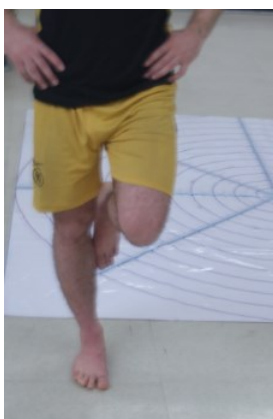
شکل . آزمون تعادل ایستا (استورک)

جهت ارزیابی تعادل ایستا از آزمون استورک استفاده شد (۲۱). بدین ترتیب که ورزشکار بر روی پای غیربرتر خود - ایستاده و کف پای برتر خود را به نحوی در کنار داخلی زانوی پای غیربرتر خود قرار می‌داد که انگشتان به سمت پایین قرار بگیرند. دستان در کنار کمر و بر روی تاج خاصه قرار می‌گرفت و با فرمان آزمونگر، از فرد خواسته شد تا چشمان خود را بسته و پاشنه پای غیربرتر را از زمین بلند کند و بر روی سینه پا بایستد. همزمان با بلند شدن پاشنه فرد، مدت زمان مربوط به انجام تست ثبت شد. در صورتیکه تعادل وی به هر دلیلی به هم می‌خورد و یا مرتکب خطا می‌شود، زمان قطع و رکورد وی ثبت شد؛ لازم به ذکر است که در آزمون استورک، زمان بالاتر بیانگر تعادل ایستای بهتر آزمودنی است. هر آزمودنی این تست را ۳ مرتبه اجرا و میانگین ۳ اجرای صحیح وی به عنوان رکورد نهایی در نظر گرفته شد. روسیتر ۱ پایایی خوبی (۰/۶۶) برای این آزمون گزارش کرده است (۲۲).