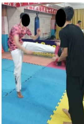
شکل ۱. پروتکل خستگی عملکردی

جهت اعمال پروتکل خستگی، از پروتکل خستگی عملکردی رشته تکواندو که اثرگذاری آن پیش از این توسط میرجانی و همکاران به اثبات رسیده است استفاده شد (۳). پروتکل مذکور به این صورت بود که آزمودنی‌ها ضربه آبدولیوچاگی را با حداکثر توان و در حداقل زمان اجرا، در مسیر هشت متری (برابر با طول زمین تکواندو) بصورت متوالی (یک ضربه با پای چپ و یک ضربه با پای راست) و رفت و برگشت، اجرا کنند. هر رفت و برگشت در این مسیر یک ست در نظر گرفته شد و پیش از اجرای پروتکل خستگی به منظور آشنایی افراد با نحوه‌ی اجرا، هر آزمودنی دو مرتبه ست مذکور را اجرا کرد. پس از شروع در جریان پروتکل خستگی بین هر ست دو برابر زمان به دست آمده در ست اول (نسبت کار به استراحت یک به دو) به افراد استراحت فعال بصورت رقص پای تکواندو داده شد، تا جایی که فرد به خستگی برسد. خستگی زمانی در نظر گرفته شد که افراد ۳۰ مرتبه این ست را در مدت زمان حداقل ۱۹ دقیقه طی کرده و بر اساس مقیاس بورگ، خستگی برابر با ۱۷ به بالا را گزارش کنند (۳).