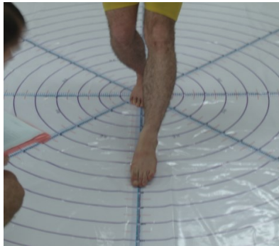
شکل ۳. آزمون تعادل پویا (۲)

تبادل ایستا، هر آزمودنی این تست را سه مرتبه اجرا و میانگین سه اجرای وی به عنوان رکورد نهایی وی در نظر گرفته شد. شافر ۱ پایایی بسیار بالایی (۰/۹۳ - ۰/۸۵) را برای این آزمون گزارش کرده است (۲۳).