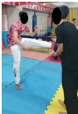
شکل ۱. پروتکل خستگی عملکردی

جهت اعمال پروتکل خستگی، از پروتکل خستگی عملکردی رشته تکواندو که اثرگذاری آن پیش از این توسط میرجانی و همکاران به اثبات رسیده است استفاده شد (۳). پروتکل مذکور به این صورت بود که آزمودنی‌ها ضربه آبدولیوچاگی را با حداکثر توان و در حداقل زمان اجرا، در مسیر هشت متری (برابر با طول زمین تکواندو) بصورت متوالی (یک ضربه با پای چپ و یک ضربه با پای راست) و رفت و برگشت، اجرا کنند. هر رفت و برگشت در این مسیر یک ست در نظر گرفته شد و پیش از اجرای پروتکل خستگی به منظور آشنایی افراد با نحوه‌ی اجرا، هر آزمودنی دو مرتبه ست مذکور را اجرا کرد. پس از شروع در جریان پروتکل خستگی بین هر ست دو برابر زمان به دست آمده در ست اول (نسبت کار به استراحت یک به دو) به افراد استراحت فعال بصورت رقص پای تکواندو داده شد، تا جایی که فرد به خستگی برسد. خستگی زمانی در نظر گرفته شد که افراد ۳۰ مرتبه این ست را در مدت زمان حداقل ۱۹ دقیقه طی کرده و بر اساس مقیاس بورگ، خستگی برابر با ۱۷ به بالا را گزارش کنند (۳).