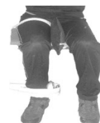
شکل ۱. آزمون چرخش خارجی ران