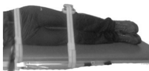
شکل ۲. آزمون دور کردن ران