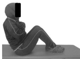
شکل ۳. آزمون فلکشن ۶۰ درجه تنه