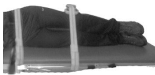
شکل ۲. آزمون دور کردن ران