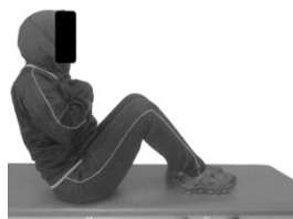
شکل ۳. آزمون فلکشن ۶۰ درجه تنه