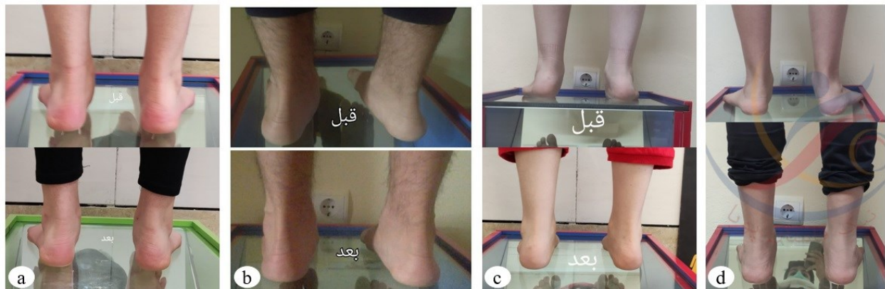
شکل ۳. نمونه‌ای از تغییرات ایجاد شده در پس‌آزمون نسبت به پیش‌آزمون در یک آزمودنی از هر گروه تحقیق؛ (a) کنترل، (b) تمرینات ایترنسیک، (c) تمرینات ایترنسیک + اکسترنسیک، (d) تمرینات جامع