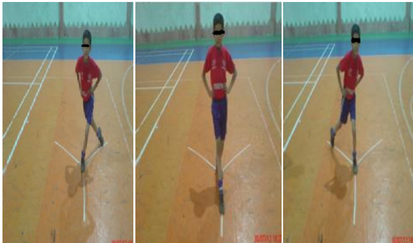
شکل ۱. روش اندازه‌گیری تعادل پویا

آزمودنی شش بار تمرین کرد تا روش اجرای آزمون را فرا بگیرد. آزمودنی در مرکز محل تست روی یک پا ایستاده و با پای دیگر در جهتی که آزمون‌گر انتخاب می‌کند عمل دستیابی حداکثری را بدون خطا انجام می‌داد و به حالت اولیه برمی‌گشت. به منظور از بین بردن اثر یادگیری، هر آزمودنی هرکدام از جهت‌ها را شش بار با فاصله ۱۵ ثانیه استراحت تمرین می‌کرد. بعد از پنج دقیقه استراحت آزمودنی آزمون را در جهتی که آزمون‌گر به صورت تصادفی انتخاب می‌کرد شروع می‌نمود، محل تماس پا تا مرکز محل تست برحسب سانتی‌متر توسط آزمون‌گر اندازه‌گیری می‌شد. آزمون برای هر آزمودنی سه بار تکرار شد. بهترین رکورد تقسیم بر طول پا می‌شد، سپس در عدد ۱۰۰ ضرب می‌گردید تا فاصله دستیابی برحسب درصد طول پا به دست آید. در صورت بروز خطا، اگر پایی که در مرکز قرار داشت حرکت می‌کرد یا تعادل فرد دچار اختلال می‌شد از آزمودنی خواسته می‌شد آزمون را تکرار کند (۲۶). پس از آزمون نرمال بودن توزیع میانگین داده‌ها از طریق آزمون کولموگروف-اسمیرنوف، از آزمون t مستقل برای مقایسه پیش‌آزمون و پس‌آزمون و برای مقایسه تفاوت‌های بین گروه از آزمون تحلیل واریانس یک‌طرفه (ANOVA) برای گروه مستقل استفاده شد. سطح معنی‌داری برای تمامی آزمودنی‌ها ( p \leq .05 ) در نظر گرفته شد. تمامی عملیات در نرم‌افزار SPSS نسخه ۱۶ انجام گرفت و برای رسم نمودارها از نرم‌افزار EXCEL استفاده شد.