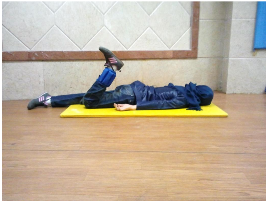
شکل ۲ تمرین قدرتی فلکشن زانو