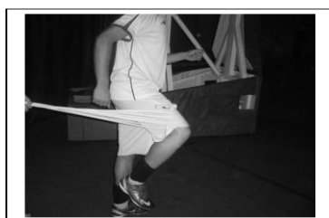
دست و پای مخالف (راه رفتن)