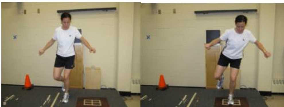
شکل ۲. نحوه انجام پروتکل جهش جانبی روی دستگاه توزیع فشار کف پای