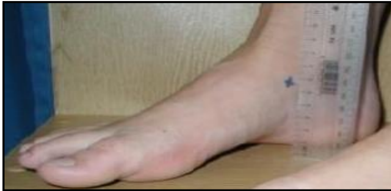
شکل ۳. اندازه گیری افت ناوی

در جدول شماره ۱، میانگین و انحراف معیار اطلاعات توصیفی مربوط به اندازه گیری های آنترپومتریک آزمودنی ها شامل قد، وزن و سن جهت شناخت بیشتر ویژگی های آزمودنی ها ارائه شده است.