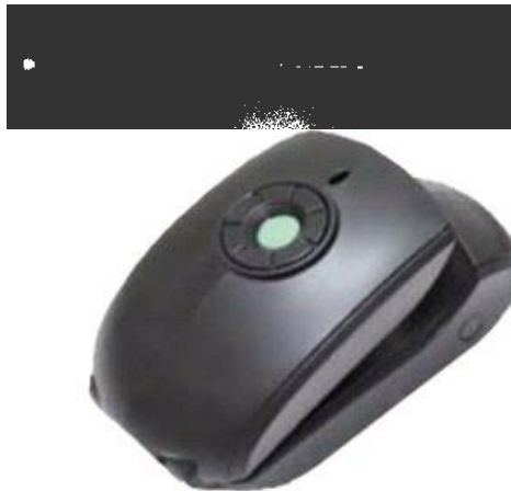
شکل ۱. سیستم آنالیزور لندمارک‌های بدنی

سیستم آنالیزور لندمارک‌های بدنی از یک قلم (فرستنده) و دوربین (گیرنده) که هر دو مجهز به سنسور IR هستند (کد ثبت اختراع: ۹۳۲۰۸) تشکیل شده است (شکل ۱).