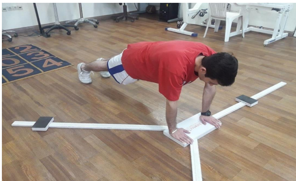
شکل ۱. شرکت کننده در حال انجام آزمون تعادلی Y

جهت ارزیابی تعادل اندام فوقانی، ابتدا فرد در وضعیت Push-up با پاها به فاصله عرض شانه و شانه مورد ارزیابی عمود بر دست و روی بلوک غیرمتحرک ابزار Y-Balance kit قرار گرفت. در این پژوهش ابتدا دست غالب و یا غیرآسیب دیده و سپس دست مقابل اندازه‌گیری شد. در همین وضعیت از بیمار خواسته شد با دست آزاد خود بلوک‌های متحرک ابزار Y-Balance kit را به ترتیب در ۳ جهت داخلی، فوقانی-خارجی و تحتانی-خارجی نسبت به دست ثابت (دست مورد ارزیابی) تا حد امکان جابه‌جا کند. سپس میزان جابه‌جایی بلوک‌ها برای هر جهت توسط آزمونگر ثبت شد. جهت نرمال کردن فواصل ثبت شده با طول اندام فوقانی، مجموع فاصله‌های ثبت شده از هر سه جهت در سه برابر طول اندام فوقانی تقسیم شده و سپس در ۱۰۰ ضرب می‌شود. عدد بدست آمده به عنوان امتیاز کلی بیمار در نظر گرفته شد. قبل از اجرای آزمون جهت اندازه‌گیری طول اندام فوقانی، بیمار در وضعیت ایستاده با بازوها در 90^\circ ابداکشن، آرنج‌ها در اکستنشن کامل و شست دست رو به بالا قرار گرفت. سپس آزمونگر با استفاده از متر نواری فاصله بین زائده خاری مهره C7 تا نوک انگشت میانی دست بیمار را ثبت کرد (13) (شکل ۱).