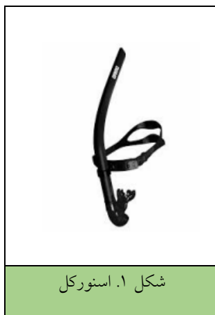
شکل ۱. اسنورکل