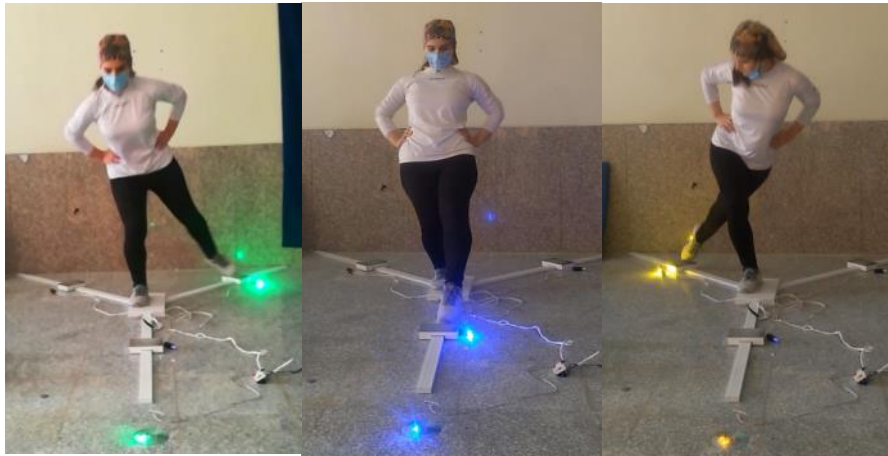
شکل ۲. نحوه اندازه‌گیری تست تعادل واکنشی

در این تست خطاهای تعادل شامل: جدا شدن دست از لگن، قدم برداشتن، سقوط، خم شدن، کج شدن هنگام عمل رساندن پا، بلند شدن پاشنه از سطح ۷، قرار دادن پای آزاد روی زمین بیش از ۲ ثانیه از موقعیت استاندارد می‌باشد.