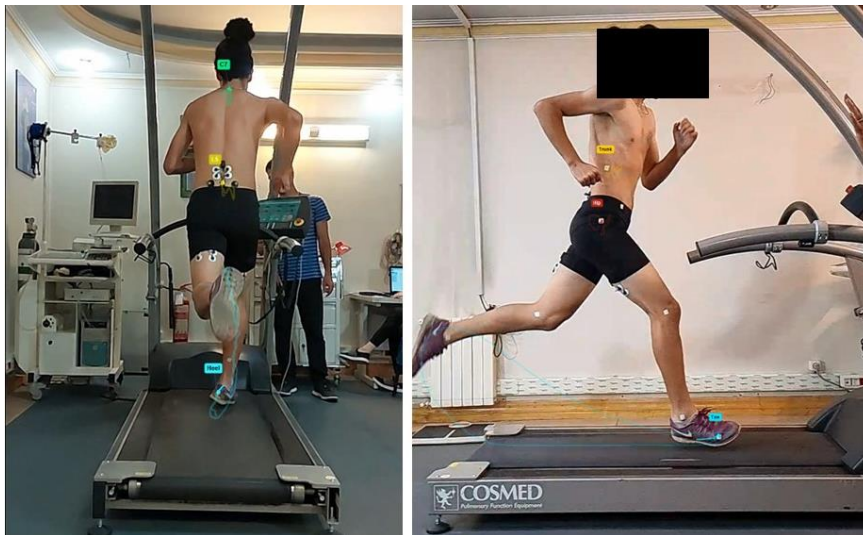
شکل ۲. آزمون دویدن

جهت بررسی کینماتیک دویدن در سرعت بالا از ارزیابی کینماتیکی دو بعدی توسط دوربین سرعت بالا ساخت شرکت سونی IMX514 (برای متغیرهای خم شدن توراسیک و خم شدن جانبی توراسیک) و همچنین ارزیابی سه بعدی کینماتیک با استفاده از شتاب سنج (ارزیابی دامنه تیلت قدامی لگن)، استفاده شد. مارکرها بر روی دنده دوازدهم، خار خاصره قدامی فوقانی، برجستگی بزرگ ران، کندیل خارجی زانو، قوزک خارجی مچ پا، استخوان پنجم کف پا، پاشنه، مهره هفتم گردنی و مهره پنجم کمری قرار گرفتند. پس از مارک‌گذاری آزمودنی‌ها و قرارگیری مناسب محل دوربین‌ها، با توجه به قد آزمودنی‌ها، آزمون دویدن بر روی تردمیل انجام گرفت. با توجه به این‌که آسیب همسترینگ در سرعت‌های بالای دویدن رخ می‌دهد، سرعت مورد استفاده در این آزمون ۲۰ کیلومتر بر ساعت و بدون شیب بود (شکل ۲). ابتدا جهت گرم کردن، ورزشکار ۱۰ دقیقه بر روی سرعت‌های کمتر شروع به راه رفتن و نرم دویدن می‌کرد. وقتی که به سرعت ۲۰ کیلومتر بر ساعت رسید به تعداد ۳۰ قدم در این سرعت می‌دوید. داده‌های مورد ارزیابی در قدم‌های بین ۱۵ تا ۲۵ ضبط شدند. همچنین این اندازه‌گیری‌ها ۳ بار انجام گرفت و میانگین داده‌ها ثبت شد. جهت جلوگیری از خستگی، آزمودنی بین هر بار دویدن ۵ دقیقه استراحت می‌کرد.