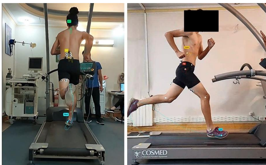
شکل ۲. آزمون دویدن

جهت بررسی کینماتیک دویدن در سرعت بالا از ارزیابی کینماتیکی دو بعدی توسط دوربین سرعت بالا ساخت شرکت سونی IMX514 (برای متغیرهای خم شدن توراسیک و خم شدن جانبی توراسیک) و همچنین ارزیابی سه بعدی کینماتیک با استفاده از شتاب سنج (ارزیابی دامنه تیلت قدامی لگن)، استفاده شد. مارکرها بر روی دنده دوازدهم، خار خاصره قدامی فوقانی، برجستگی بزرگ ران، کندیل خارجی زانو، قوزک خارجی مچ پا، استخوان پنجم کف پا، پاشنه، مهره هفتم گردنی و مهره پنجم کمری قرار گرفتند. پس از مارکگذاری آزمودنی ها و قرارگیری مناسب محل دوربین ها، با توجه به قد آزمودنی ها، آزمون دویدن بر روی تردمیل انجام گرفت. با توجه به این که آسیب همسترینگ در سرعت های بالای دویدن رخ می دهد، سرعت مورداستفاده در این آزمون ۲۰ کیلومتر بر ساعت و بدون شیب بود (شکل ۲) (۲۴). ابتدا جهت گرم کردن، ورزشکار ۱۰ دقیقه بر روی سرعت های کمتر شروع به راه رفتن و نرم دویدن می کرد. وقتی که به سرعت ۲۰ کیلومتر بر ساعت رسید به تعداد ۳۰ قدم در این سرعت می دوید. داده های مورد ارزیابی در قدم های بین ۱۵ تا ۲۵ ضبط شدند. همچنین این اندازه گیری ها ۳ بار انجام گرفت و میانگین داده ها ثبت شد. جهت جلوگیری از خستگی، آزمودنی بین هر بار دویدن ۵ دقیقه استراحت می کرد.