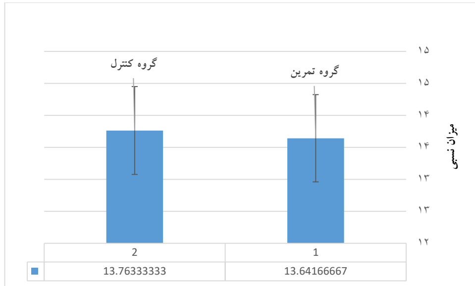
نمودار ۱. میانگین و انحراف استاندارد \Delta ct GPX4 در هر دو گروه