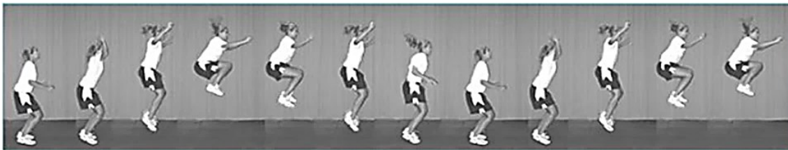
شکل ۱. تست پرش تاک (۳۳)

در این پژوهش قد آزمودنی‌ها با قدسنج و وزن آن‌ها از ترازوی دیجیتال استفاده شد. جهت ارزیابی نقص تنه از تست پرش تاک با پایایی بین آزمونگر (۹۳/۱) و پایایی درون آزمونگر (۸۷/۱) استفاده شد. در این آزمون فرد با پاهای باز به اندازه عرض شانه می‌ایستد و به صورت عمودی شروع به پرش می‌کند و زانوهای خود را تا حد امکان بالا می‌آورد. در بالاترین نقطه پرش، ران‌ها موازی با زمین قرار می‌گیرند. بلافاصله بعد از فرود، فرد باید پرش تاک بعدی را شروع کند. آزمودنی پرش تاک را به مدت ۱۰ ثانیه به صورت متوالی تکرار می‌کند. برای بهبود دقت ارزیابی از دو دوربین فیلمبرداری در دو نمای قدامی و جانبی استفاده شد، دوربین‌ها با فاصله سه متری از آزمودنی‌ها تنظیم شدند تا تصویر به صورت درشت‌نمایی شده برای بررسی در اختیار پژوهشگر قرار بگیرد، پس از انجام آزمون، برای بررسی سکانس‌های پرش، از نرم‌افزار کینوا استفاده شد فردی که قادر نباشد در محل شروع پرش خود فرود بیاید، در نقطه اوج پرش ران‌های موازی با زمین قرار نگیرد و پرش هایش در طول ۱۰ ثانیه با وقفه انجام گیرد، به عنوان فرد دارای نقص تنه در نظر گرفته شد (۱۸). هر آزمودنی سه بار با آزمون پرش ارزیابی شد و میانگین امتیازات ورزشکاران ثبت شد تا افراد مبتلا به نقص عصبی - عضلانی و به خصوص نقص تنه شناسایی شوند (شکل ۱) (۱۸).