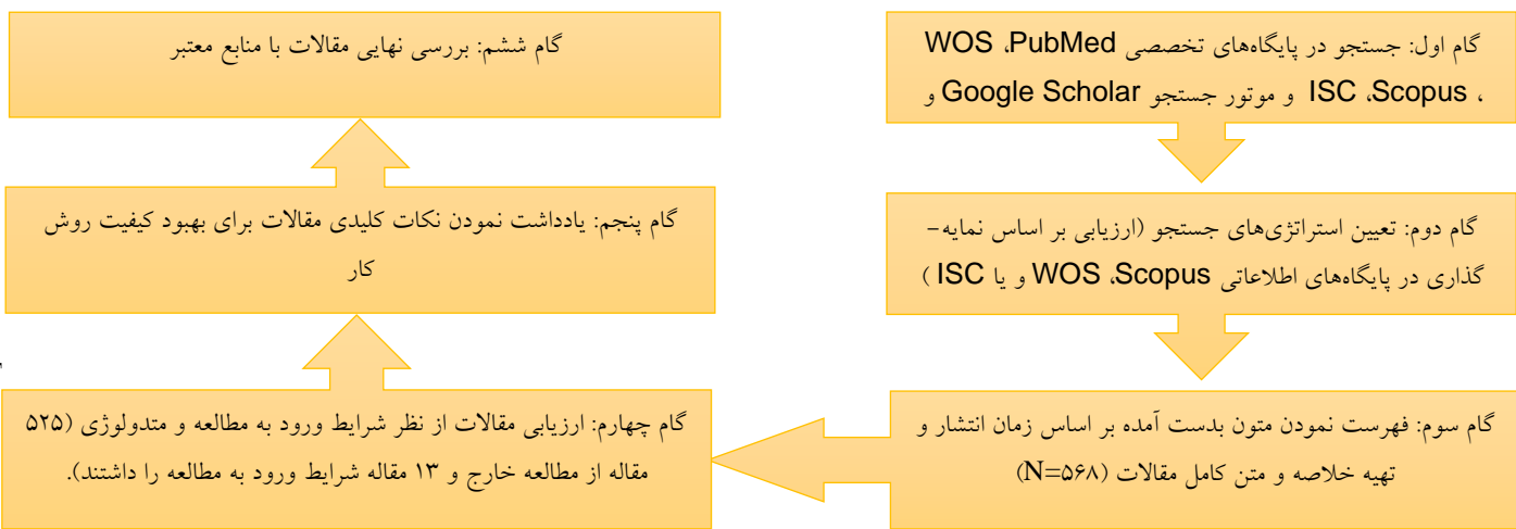
دیاگرام 1. نحوه بررسی کیفیت مقالات

تحلیل حذف شد. برای مشخص کردن عدم تجانس از آزمون I^2 استفاده شد که مقدار ناهمگونی بر اساس دستورالعمل کوکران به شرح زیر > 25\% = کم ، > 50\% = متوسط و > 75\% = ناهمگونی زیاد تفسیر شد. در صورت وجود ناهمگونی، در ادامه تحلیل حساسیت از طریق روش خارج کردن یک به یک مطالعات با لحاظ کردن I^2 کمتر از 50 به عنوان ملاک انجام شد (13). سوگیری انتشار نیز با استفاده از تفسیر بصری از فونل پلات بررسی شد که در صورت وجود سوگیری، تست ایگر به عنوان به مشخص کننده ثانویه استفاده شد که در آن P < 0.1 به عنوان وجود سوگیری انتشار قلمداد شد. همچنین همبستگی سن و شاخص توده بدن آزمودنی‌ها با اندازه اثر تفاوت‌های میانگین استاندارد شده با استفاده از رگرسیون مدل لحظه‌ای بررسی شد (13). تمام آزمون‌های آماری با استفاده از نرم افزار CMA انجام شدند.